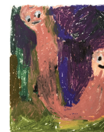
Georg Óskar Sunday and Monday, 2019 Oliepastel op papier 30 x 24 cm € 550