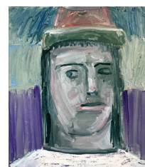
Georg Óskar Aron, 2018 Olieverf op doek 50 x 40 cm € 1.650