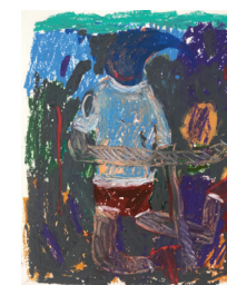
Georg Óskar Crack and Smack, 2019 Oliepastel op papier 30 x 24 cm € 550