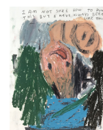
Georg Óskar Always Been Like This, 2019 Oliepastel op papier 30 x 24 cm € 550