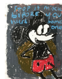
Georg Óskar Stop it Mikki, 2019 Oliepastel op papier 30 x 24 cm € 550