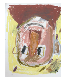
Georg Óskar Untitled, 2019 Oliepastel op papier 30 x 24 cm € 550