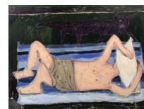
Georg Óskar Head under pillow 2019 Olieverf en acryl op doek, 125 x 165 cm € 5.250