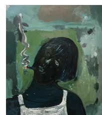
Georg Óskar Lulu, 2019 Olieverf op doek 90 x 80 cm € 3.050