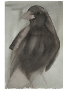
Anne van As Crow (black) 2017 Oost-Indische inkt, acryl en potlood op papier 30 x 21 cm op aluminium