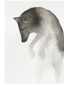
Anne van As Jump, 2016 Oost-Indische inkt, acryl en potlood op papier 20 x 15 cm

De dieren in de tekeningen van Anne van As hebben een zachte uitstraling en subtiele elegantie, maar zijn tegelijkertijd sterke persoonlijkheden. De kraaien, hazen, herten en rendieren kijken je eigenwijs aan. Ze lijken bijna menselijke eigenschappen te hebben en worden ook steeds vaker in een setting geplaatst die lijkt op een decor of filmset. Van As' beelden, met hun dromerige, zachte kwaliteiten en toegankelijke onderwerpen, zijn toch steeds wat melancholisch en een beetje onheilspellend.