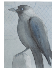
Anne van As BlueBB 2017 Oost-Indische inkt, acryl en potlood op papier 20 x 15 cm