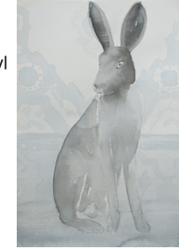
Anne van As Untitled 2017 Oost-Indische inkt, acryl en potlood op papier 30 x 21 cm