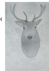
Anne van As Hunting 2017 Oost-Indische inkt, acryl en potlood op papier 30 x 21 cm