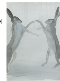
Anne van As Fight at Venice 2017 Oost-Indische inkt, acryl en potlood op papier 38 x 28 cm