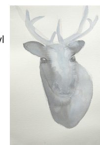
Anne van As Hunter 2017 Oost-Indische inkt, acryl en potlood op papier 30 x 21 cm op aluminium